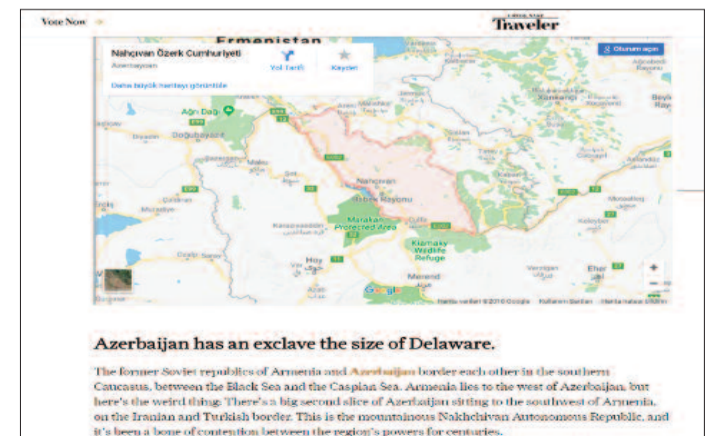
Azerbaijan has an exclave the size of Delaware.

The former Soviet republics of Armenia and Azerbaijan border each other in the southern Caucasus, between the Black Sea and the Caspian Sea. Armenia lies to the west of Azerbaijan, but here's the world's only big second slice of Azerbaijan sitting to the southeast of Armenia, on the Russian and Turkish border. This is the mountainous Nakhchivan Autonomous Republic, and it's been a source of controversy between the region's powers for centuries.